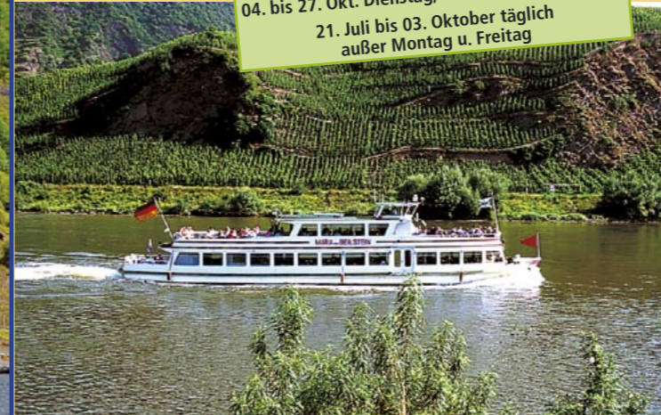
MS "Maria von Beilstein"

28. April bis 02. Juni / 14. Juni bis 19. Juli und 04. bis 27. Okt. Dienstag, Donnerstag u. Samstag 21. Juli bis 03. Oktober täglich außer Montag u. Freitag