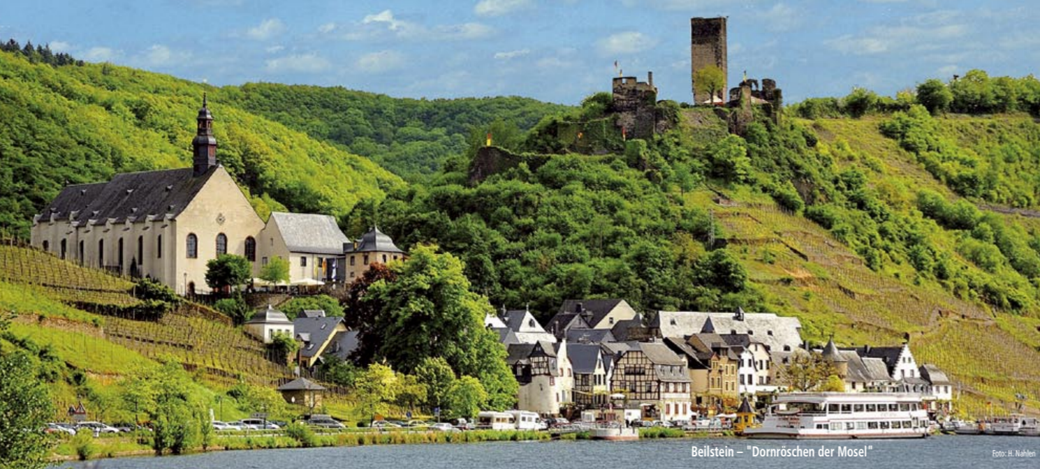
Beilstein - "Dornröschen der Mosel"